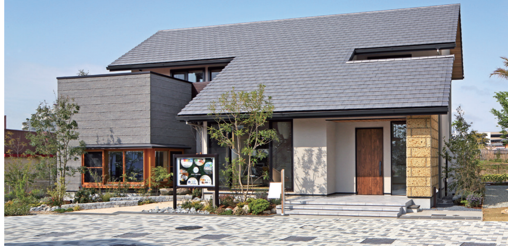
ABCハウジングウェルビーみのお箕面展示場

「四季の香り」はオーナーの皆様への会報誌です。 イムラの最新情報をはじめ、その他さまざまな情報を季刊でお届けします。